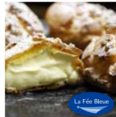
La Fée Bleue

コクのあるクリームが好評のフランス風シュークリーム「千代の華おとこシュー」の他、数々のチーズケーキをご用意します!