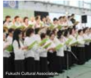
Fukuchi Cultural Association