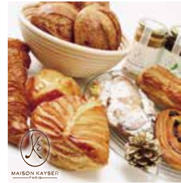
MAISON KAYSER PARIS

フランスの新聞「フィガロ」のランキングNo.1に輝いたクロワッサンなど、天然酵母・低温長時間発酵のパンをお楽しみに!