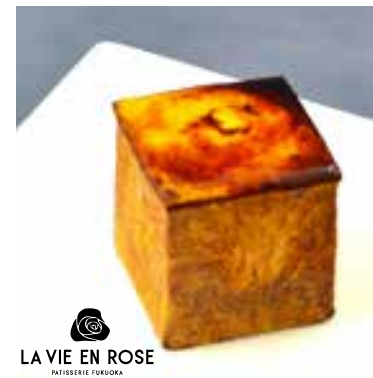
LA VIE EN ROSE FINESTELLE FUKUOKA

シュー生地をスクエアに焼き上げ、シブースクリームを詰めた「キャラメリズ」。スフレグラスのような食感が楽しめます!