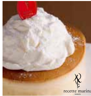
recette marina HAKATA

スフレ生地の上にカマンベールチーズ、クリームチーズ、生クリーム、カスタードクリーム、ヨーグルトを合わせてデコレーションしました。