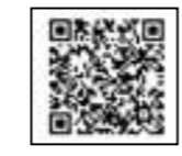
↑LINEの友達追加・申込みはこちらから