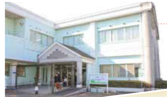
福智町地域子育て支援センター

子どもの成長は個人差が大きく、子育てに明確な答えはありません。本やインターネットでは得られない、経験豊かな先輩ママのアドバイスが受けられることも魅力の一つです。福智町のセンターは近隣