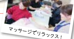
マッサージでリラックス!