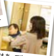
授乳室もあって安心