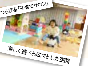
親子でくつろげる「子育てサロン」 楽しく遊べる広々とした空間

施設の利用は全て無料。イベントなどの情報は町公式ホームページや毎月発行の「ハローママ」でもチェックできます。