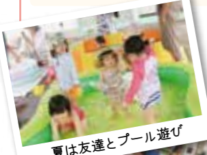
夏は友達とプール遊び

毎月絵本の読み聞かせや工作など、楽しいイベントを企画中。季節ごとの行事もあり、多くの人と楽しい時間を過ごせます。