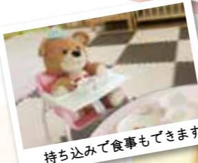
持ち込みで食事もできます

食器も借りることができ屋食も可能。新生児から幼児までの身長・体重測定もでき、充実した設備で子育てをサポートします。