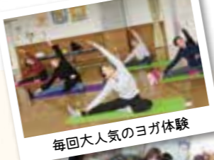
毎回大人気のヨガ体験

子育ての悩み解消につながる育児相談や実用的な講習のほか、ヨガ教室やマッサージなど体験企画も好評です。