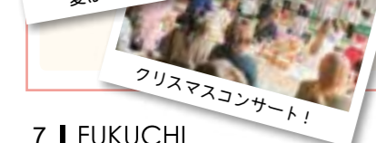
クリスマスコンサート!