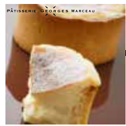
チーズケーキフォンデュ

果樹園を営み隣接する直営レストラン。行列のできるお店としても有名で、とれたて新鮮果実を使ったスイーツは絶品。