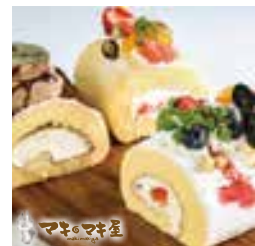
コロコロフルーツ

ゴーダとカマンベールをブレンドし、ロドにこだわった「こだわり*極*チーズ」がイチ押し。やみつきになるチーズケーキです。