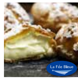
千代の華おとこシュー