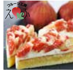
いちじくのタルト

北九州市を代表する名店。秋限定の「抹茶栗ロール」をはじめ、極上のプリンなど、感動のスイーツに出会えます。