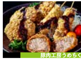
豚肉工房うめちく

奥深い風味と辛さが絶妙な自家製めんたいをからめた「めんたい唐揚げ」、ジューシーで香ばしいサクサクの「唐揚げ」、いずれも老舗割烹こだわりの味をご用意！