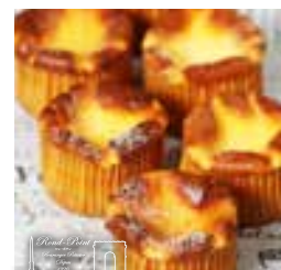
バスクチーズケーキ

スフレ生地の上にカマンベールチーズ、クリームチーズ、生クリーム、カスタードクリーム、ヨーグルトを合わせてデコレーションしました。