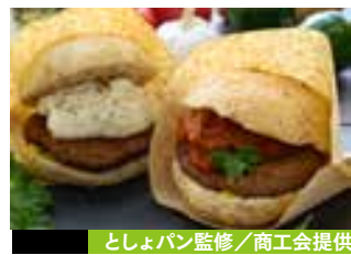
としよパン監修/商工会提供

「焼肉ポタ山」の秘伝タレは頑固なまでに受け継がれた炭都・筑豊の逸品。そのタレと相性抜群のカルビで作った「牛カルビ丼」、福智産の新米で極上の丼を！