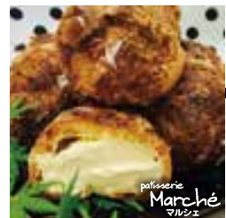
黒糖かりんとシュー

人気商品は「コロコロフルーツ」。苺、キウイ、オレンジ、グレープフルーツ、パイナップルを生クリームと一緒にマキマキしました！