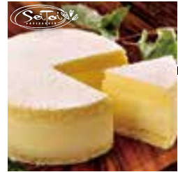
こだわり*極*チーズ

福岡で絶大な人気を誇るジョルジュマルソー。代表商品の「チーズケーキフォンデュ」は売切必至、お早めにお求めを！