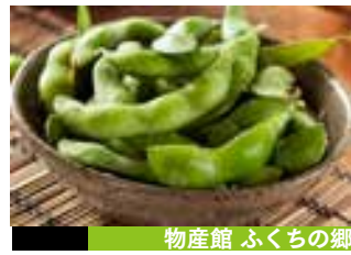
物産館 ふくちの郷

お昼時の数時間で連日完売するラーメンまむしが来店。豚骨を福智の天然水で半日以上煮詰めた濃厚でクリーミーな旨さ極まるスープをお楽しみください。