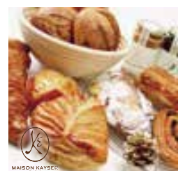
クロワッサンオザマンド

創業30周年、新飯塚駅前の老舗スイーツ店。地元食材を使ったケーキや当初から大人気の「パレット」などをご用意。