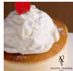
スフレチーズカマンベールクリームのせ

八女伝統本玉露の茶館をやわらかい羽二重餅で包み込み、仕上げに八女伝統本玉露と和三盆をまぶしました。