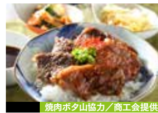
焼肉ポタ山協力/商工会提供