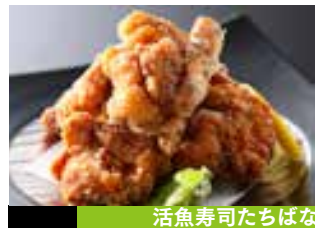
活魚寿司たちばな

福智山麓の自然に囲まれた豊かな環境で育った安心安全な農作物が並ぶ「ふくちの郷」からビールに欠かせない「枝豆」と高精度な紅はるかの「焼芋」をお届け！