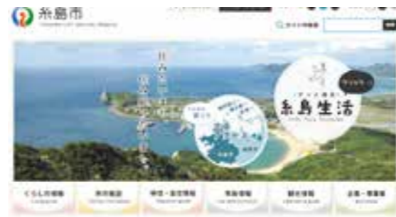
↑豊かな自然が目立つ糸島市HPのトップ画面。広報紙と連携した情報発信も評価されています。

←「ホームページご意見箱」に寄せられた意見は個別に回答は行いません。必要な場合は電話等でお問い合わせください。