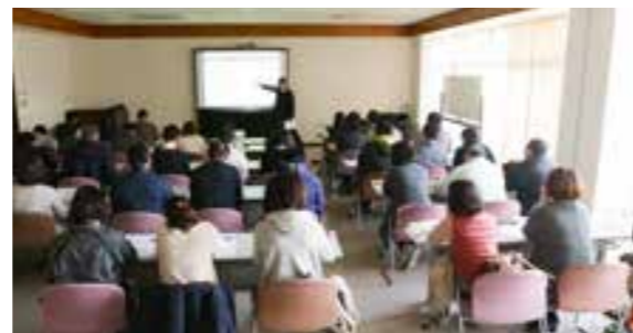
↑全職員対象の操作研修を4回に分けて実施。各担当課による迅速で質の高い情報発信を目指します。

ページから離れると言われている。福智町のHPは画像やアイコンなど視覚要素を増やしたすっきりとしたデザインが特徴。利用者が情報を見つけやすい配置になっていると思います。またHP全体の高いデザイン性も魅力。作り込まれたバナーやページの細部までこだわった観光サイトもぜひ見ていただきたいです。